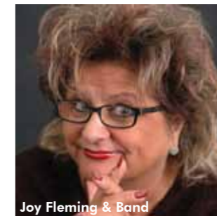
Joy Fleming & Band