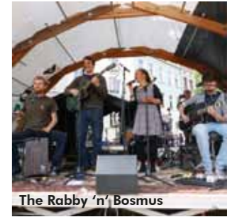
The Rabby 'n' Bosmus